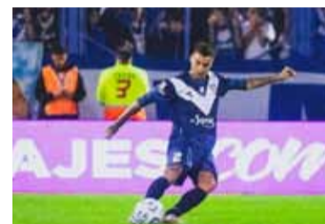
Mammana. Reflexionó sobre su futuro.

A su vez, agregó que, a comparación del "Millonario", el "Fortín" si confió en él para sumarlo a su equipo en la temporada 2024: "Vélez confió en mí