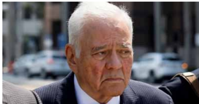
Bolivia. Histórico fallo contra Lozada, expresidente

Tras una semana de ofensiva de los rebeldes islamistas apoyados por Turquía en el noroeste de Siria, el presidente sirio, Bachar al Asad, ha mandado refuerzos a la provincia de Hama ante el avance de los insurgentes hacia esta estratégica ciudad del centro-norte del país árabe.