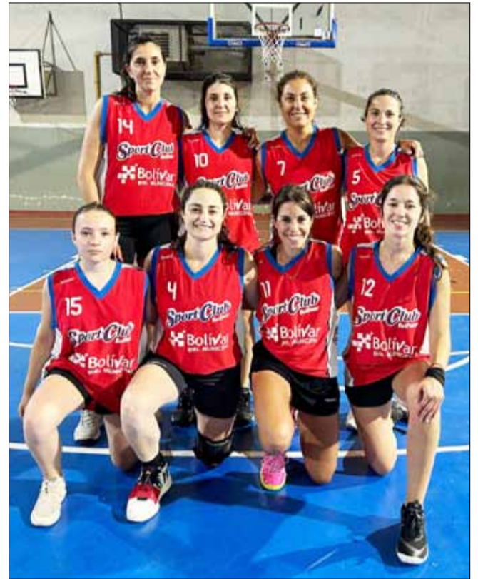
"Las Lebronas", Femenino.