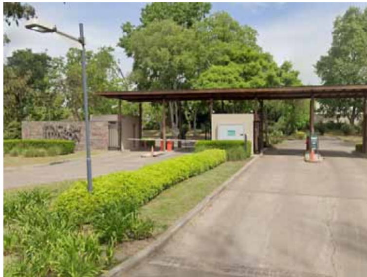
En el country de Hudson. Se produjo la tragedia familiar con desenlace fatal

Hasta ahora, no se presentaron familiares o vecinos del country que puedan explicar lo que pasó, por lo que todavía el fiscal no cuenta con los testigos necesarios para construir