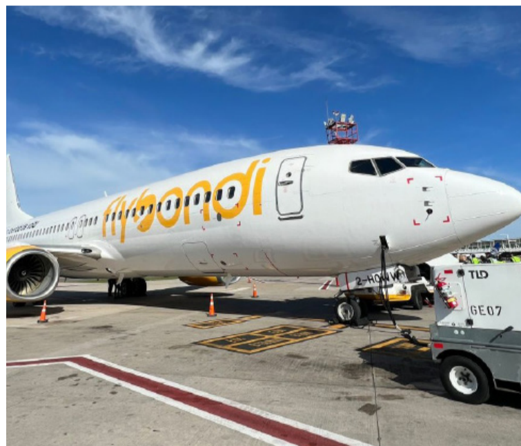
Flybondi. Bajo presión por cancelaciones y fallas operativas.

La Secretaría de Transporte del Ministerio de Economía de la Nación intimó a la línea aérea FlyBondi para que presente en el plazo de 48 horas un plan correctivo con el objetivo de reducir drásticamente las cancelaciones que está teniendo la empresa y que afectan diariamente a miles de pasajeros.