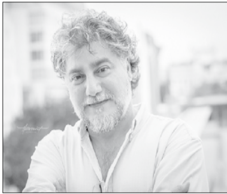
José Cura, tenor argentino.