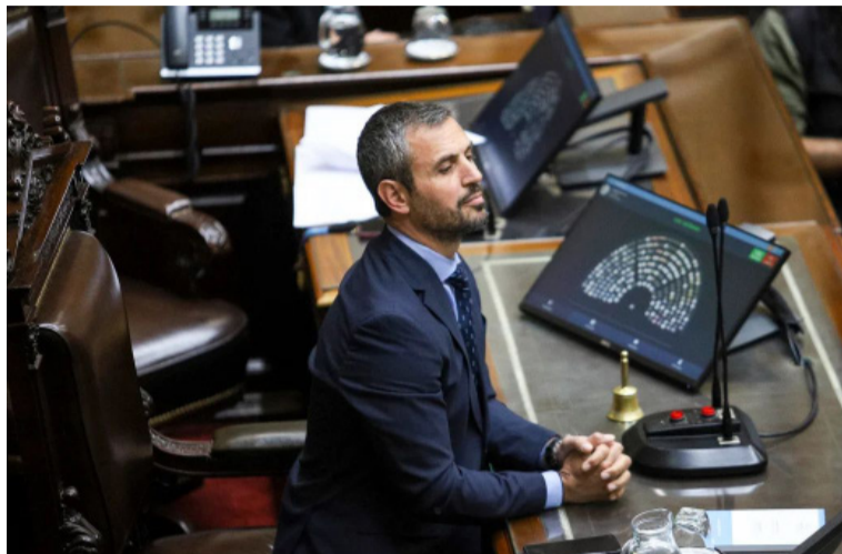
Menem. Reelegido como presidente de Diputados

El diputado de la La Libertad Martín Menem fue reelecto ayer como presidente de la Cámara baja hasta el 9 de diciembre de 2025.