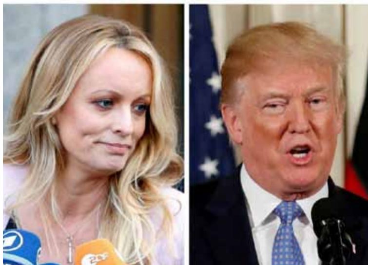
Trump. Pide sobreseimiento en caso con actriz Stormy Daniels

Asimismo, la defensa invoca la doctrina de la inmunidad presidencial (dictaminada por la Corte Suprema que dictaminó que los presidentes tienen inmunidad por sus actos oficiales) y la Ley de transición presidencial, entre