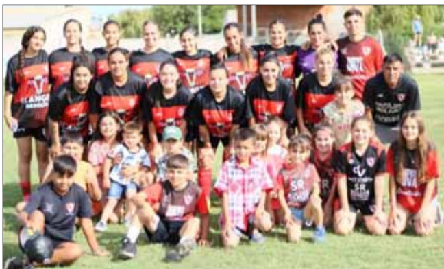
El Rojo, en la rama femenina, ya es tricampeón.