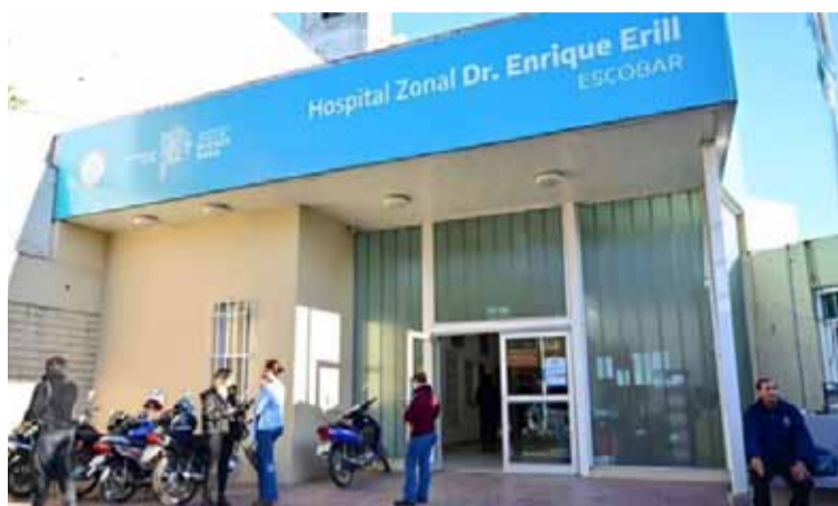
El rol de extranjeros. En la salud pública bonaerense.

Asimismo, el 0,2% de personas vacunadas por el calendario nacio-