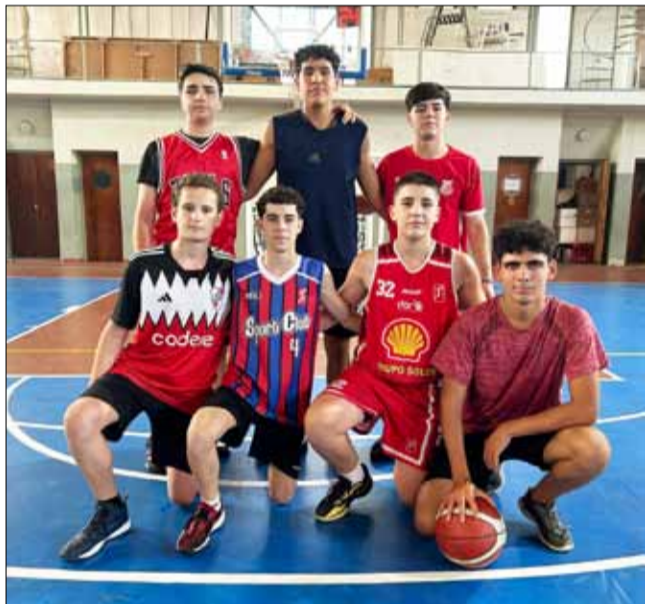
"Raviolos con tuco", U15-U17

*U15/U17/Primera femenino: 1° New York Liberty vs 4° Indiana Sports; 2° Las Lebronas vs 3° Las Warriors.