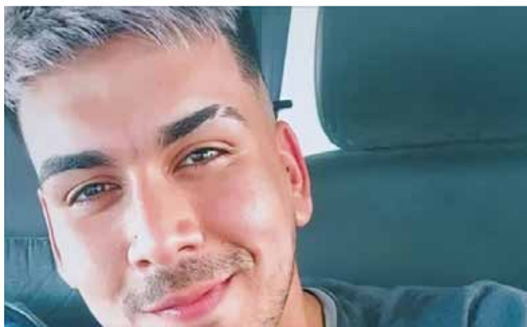
Fatal choque en peaje. Conmoción por mensaje de despedida.

Por otra parte, amigos y familiares del fallecido asegura-