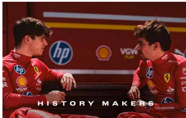
Los Leclerc. Hacen historia en Ferrari y la Fórmula 1.

Ferrari confirmó que el piloto Arthur Leclerc, hermano menor de Charles Leclerc, tomará el volante del monoplaza de Carlos Sainz durante las primeras prácticas libres del Gran Premio de Abu Dhabi, marcando un hito en la historia de la Fórmula 1, ya que será la primera vez que dos hermanos compiten en una misma sesión oficial y para el mismo equipo.