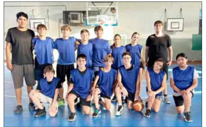
"Charlotte Hornets", Mini-U13.