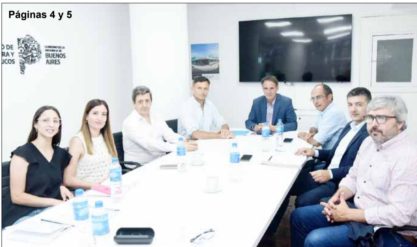
Páginas 4 y 5

EDITÓ UN LIBRO IMPRESO EN MAYO DE ESTE AÑO